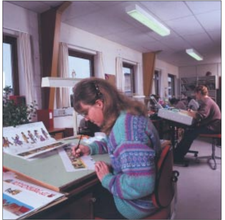
Eskesenin tehtaan taideosaston työtä.

vät menettivät Pederin syrjä-hypyssä kynäteollisuuteen, ovat keräilijät voittaneet huip-pulaatuisten kynien muodosa.