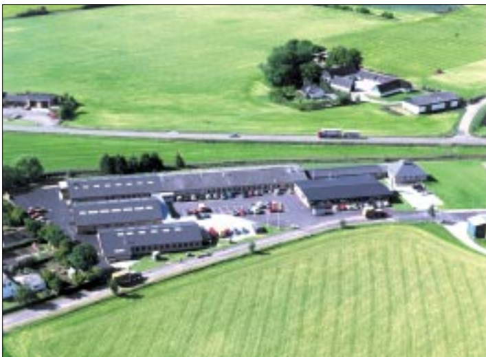
Eskesenin tehdas Tanskassa on keskellä maaseutua.